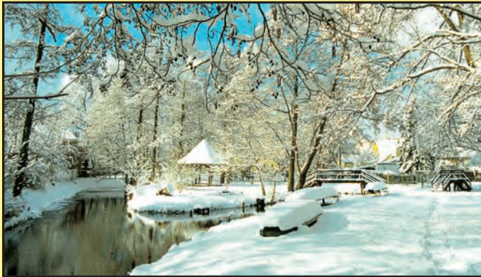
Winter im Spreewald

Viel Sehenswertes in Burg und seiner Umgebung und erholsame Stunden im idyllischen Biosphärenreservat Spreewald machen Ihren Aufenthalt im „Hotel am Spreebogen“ zu einem unvergeßlichen Erlebnis.