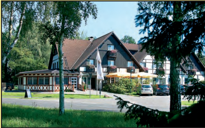
Blick auf die 2012 neuerbaute SpreeVeranda.

Die Gemeinde Burg (Spreewald) liegt mitten im UNESCO-Biosphärenreservat. Der Streusiedlungscharakter, die unzähligen Fließe und grünen Auen zeigen eine einzigartige Kultur- und Naturlandschaft. Seit 2005 ist Burg staatlich anerkannter Ort mit Heilquellen-Kurbetrieb. Ein umfangreich ausgebautes Radwegenetz, die Spreewald Therme, sowie zahlreichen kulturelle Veranstaltungen laden den Gast zum Verweilen ein.